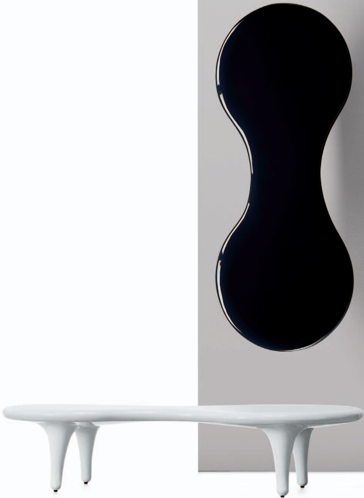
ORGONE TABLE Marc Newson 1998