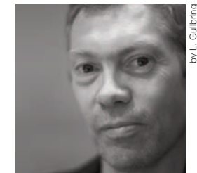
by L. Galbring

Serie di tavoli bassi rettangolari smontabili, sovrapponibili e componibili fra loro. Piano a doghe in legno massello di rovere naturale, gambe smontabili in rovere naturale tornito. I top presentano impronte circolari per sovrapporre i diversi elementi.